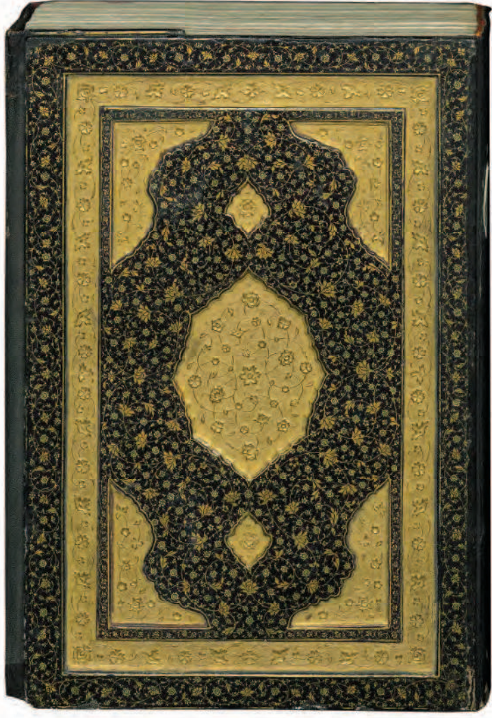
Mesnevi Cilt Kapağı, 15. yüzyıl, Env. 1905, TIEM.

hilm vs. gibi erdemlerin Hz. Peygamber'den peyda olmuş olduğunu söylemek, bunların Hz. Peygamber ile irtibatını kurulmadan dile getirilirse, bir iddiadan öte bir anlam ifade etmeyecektir. Bu erdemlerin varlığı ile Hz. Peygamber arasında nasıl bir irtibat kurulabilir? Tam da bunun keyfiyetinin gösterilmesi gerekmektedir. Mevlânâ bunu şöyle açıklıyor: "Nitekim bu el ne yaparsa, akıl sayesinde yapar. Zira aklın sâyesin onun üzerindedir." Burada, tam da burada, insanın ayırıcı iki hususiyeti birbiri ile irtibatı içinde